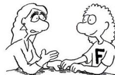
F-Typ Kann Menschen gut verstehen.