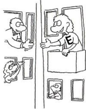
E-Typ Braucht Beziehungen.

EINSTELLUNG zur Außen- und Innenwelt und wie Sie ENERGIE gewinnen