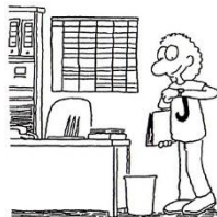
J-Typ Mag klare Abläufe und feste Routine.