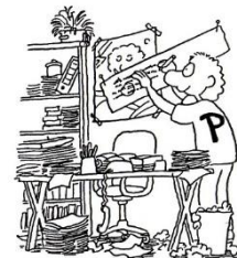
P-Typ Mag Veränderung und Vielfalt.