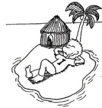
I-Typ Braucht Privatsphäre.