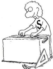
S-Typ Mag Dinge, die klar meßbar sind.