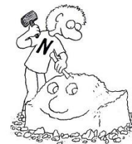
N-Typ Mag das Kreative.